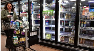
ENTREPRISE Covid-19: Instacart va recruter pour faire face à l'explosion de la demande