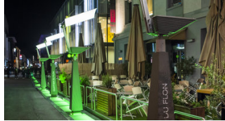
ÉPIDÉMIE Gel de printemps dans l'immobilier