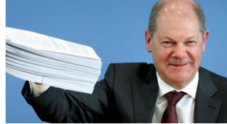
AIDES PUBLIQUES Le bal des milliards pour éviter une récession mondiale trop brutale