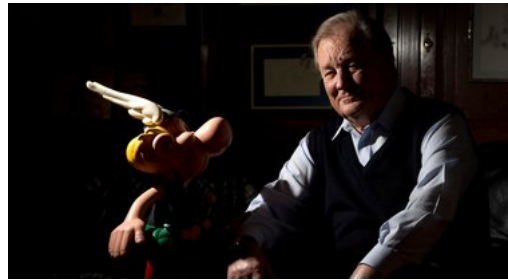
BANDE DESSINÉE Albert Uderzo, le dessinateur d'Asterix, est décédé