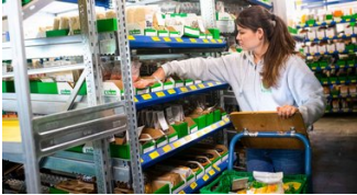
PANDÉMIE Des PME se mobilisent pour apporter leur aide dans la crise