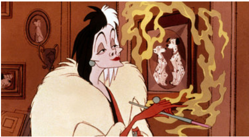
STREAMING A Le géant Disney déferle en ligne