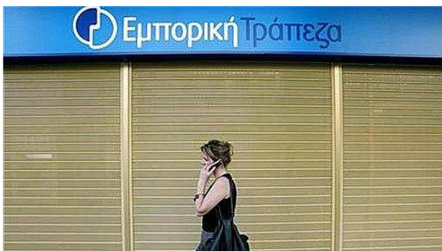
Agence Emporiki Bank of Greece, filiale du Crédit agricole.

07/05/2010 | Mise à jour : 16:25 Réactions (80)